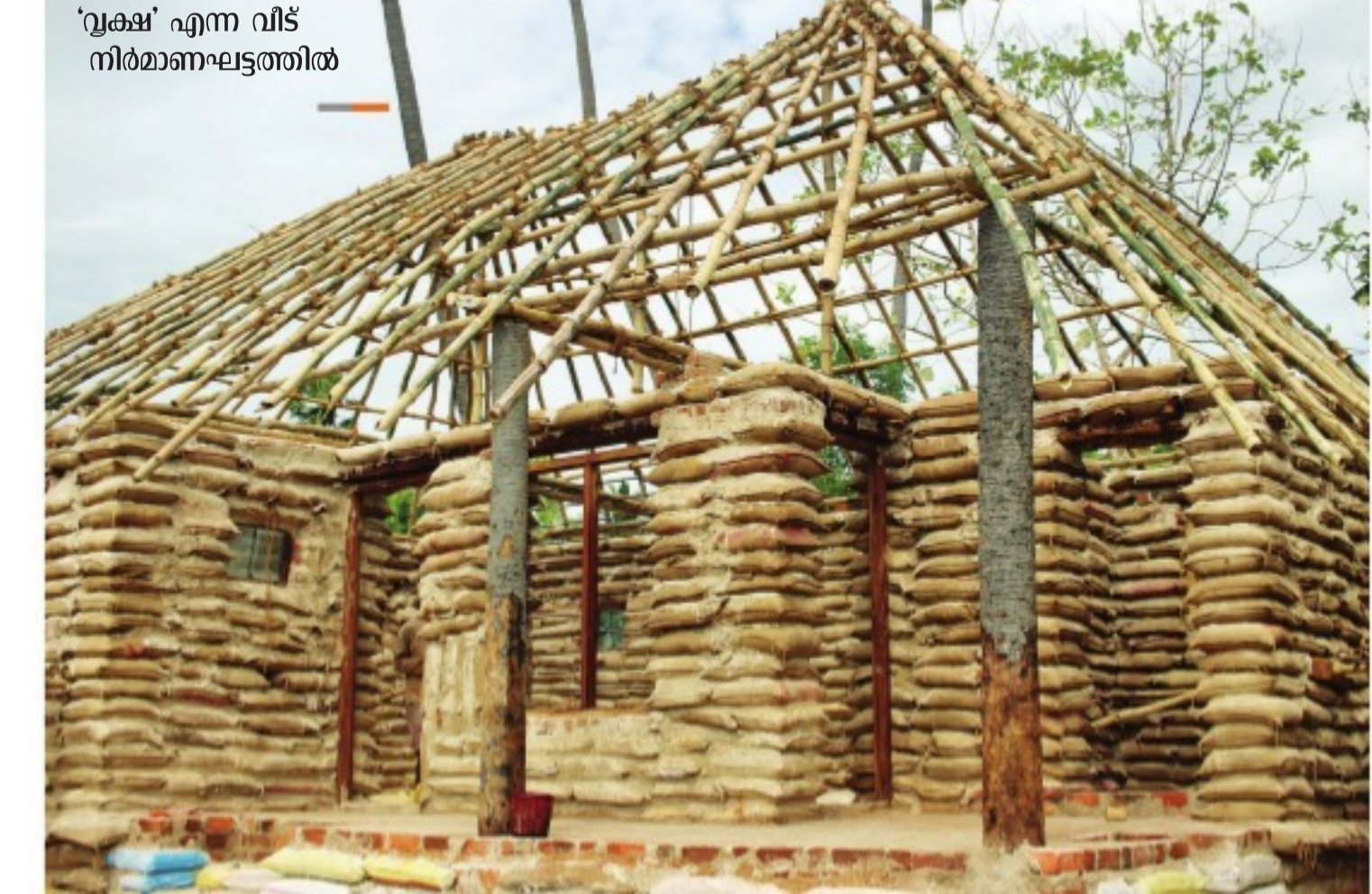
'വൃക്ഷ' എന്ന് വീട് നിർമ്മാണലട്ടത്തിൽ